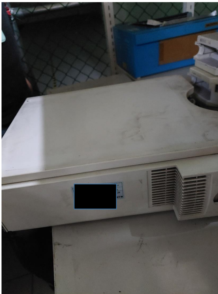
製備型高效液相層析儀