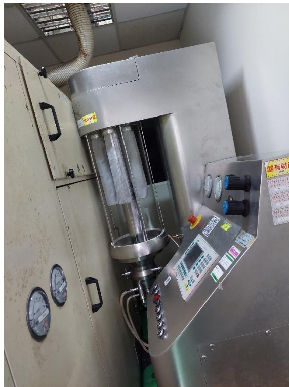
多功能包衣造衣粒機-科專超限