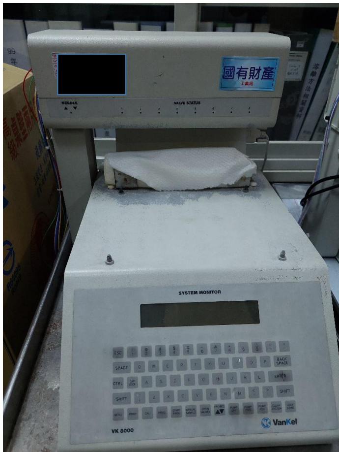
自動分離收樣設備