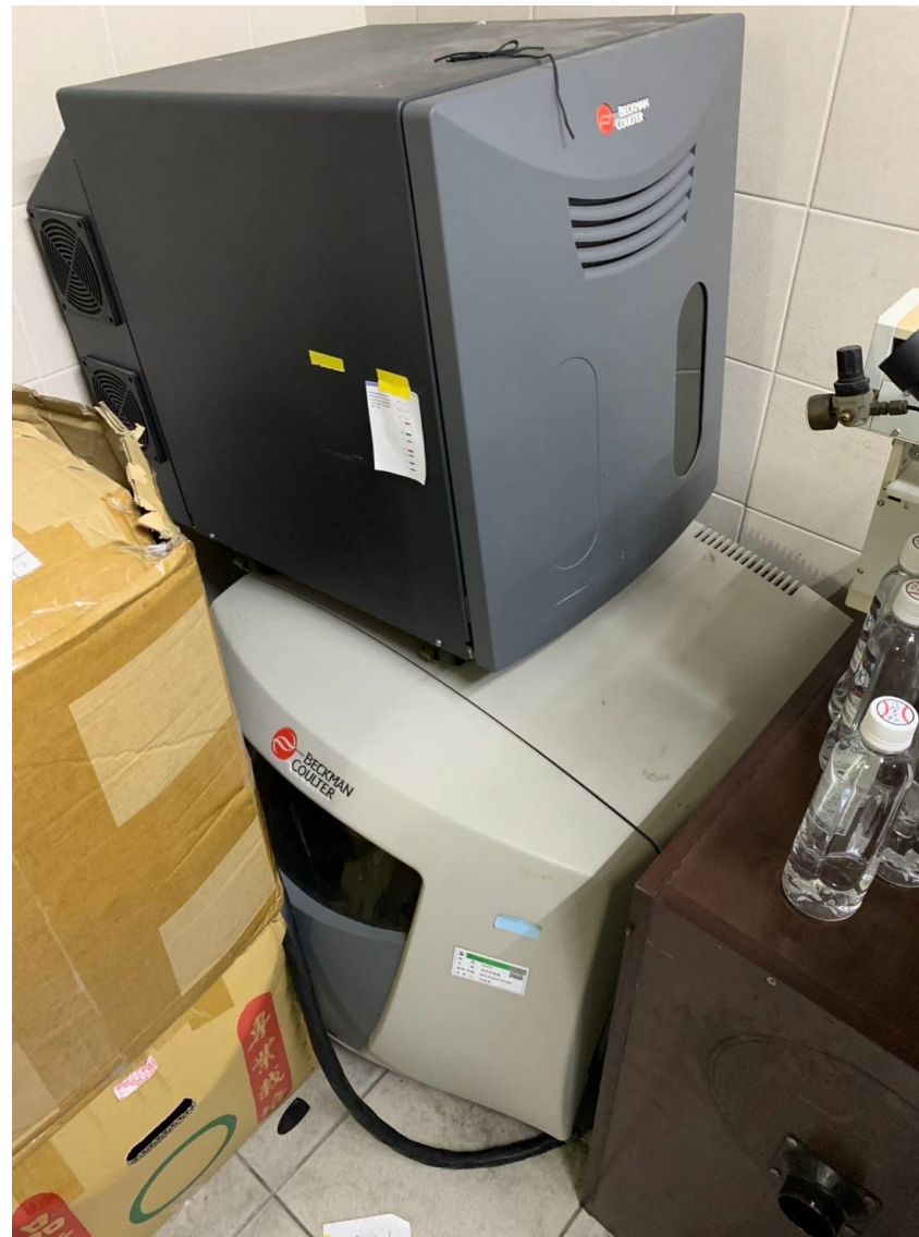
流式細胞儀(下方白色機器)